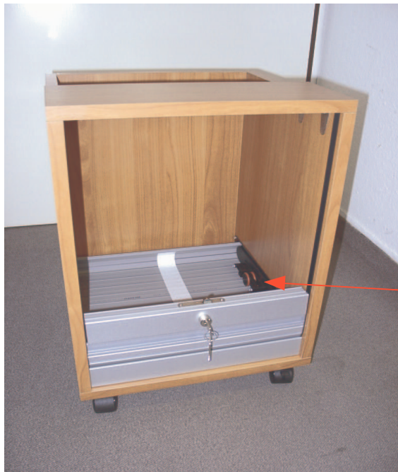
RAUVOLET CB im eingebauten Zustand